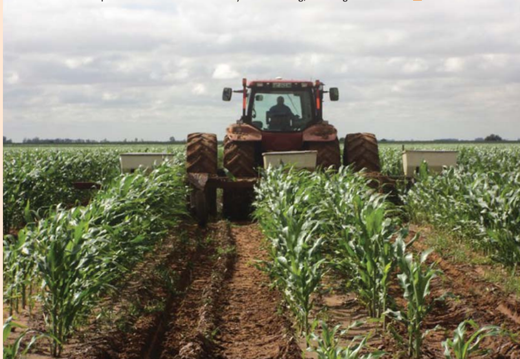
Ho kgona ho phetha fafatso ya manyolo hodima mobu.

Dihwai di tlamehile ho ba le lesedi la tsebo le ho ela dintho hloko. Moralo wa tshebetso o tshwanetse ho ba teng kelellong ya sehwei se seng le se seng mabapi le ka moo se tla sebetšana ka teng le maemo a sa tlwaelehang, a ntseng a fetofetoha. ■