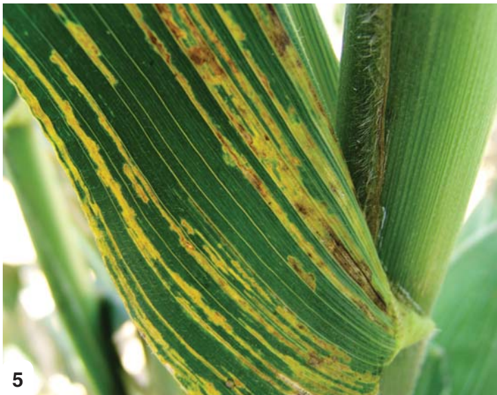
Matheba a maputswa lehlakung.