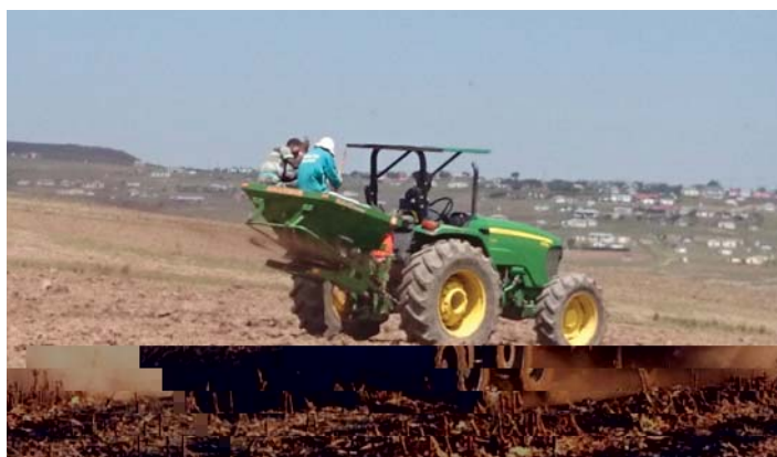
Ho etsa leqheka – ho fafatsa kalaka ka sealamanyolo.

Mokgwa o phethahetseng wa ho lokisa mobu o ka nna wa kenyeletsa tshebediso ya kalaka ya calcitic kapa dolomitic ho ntlafatsa pH, gypsum ho etsa tekatekano ya sulphur, MAP ho ntlafatsa boemo ba phosphate le KCL ho nepahatsa boemo ba potassium. Ha e sebediswa ke rakonteraka,