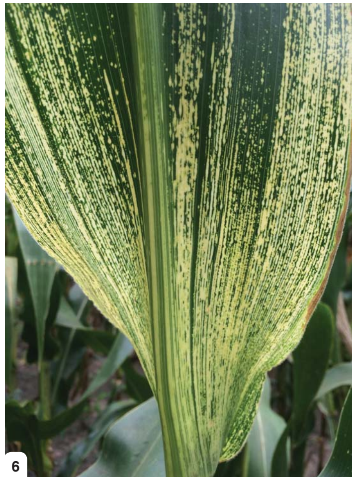
Ho tjheswa ke letsatsi/matshwao a ho kgineha mahlakung a poone.