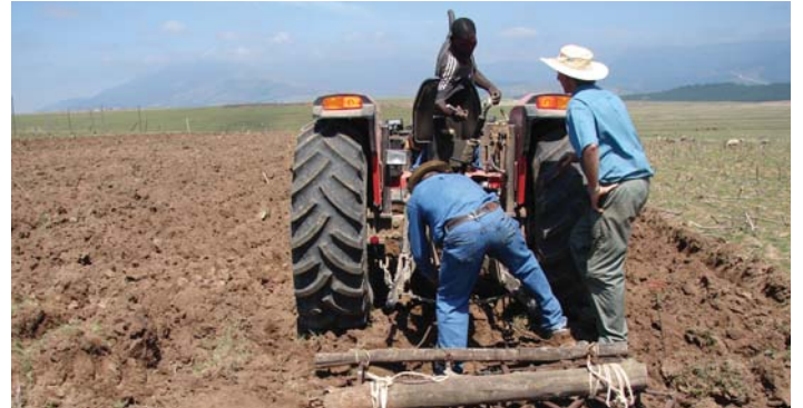
Dikamano tse ntle le basebeletsi ba hao di eketsa tlhahiso le tsona diphaello tsa hao.

ho tshwara basebeletsi hore ba be le tjheseho e matla ya tlhahiso. Ho sebetsa ka batho e ka nna ya ba ntho e thata hobane batho re fapana ka ditlwaello tsa rona, maikutlo, bokgoni, boitshwaro le diketso.