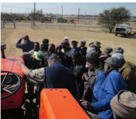
Boere ontvang opleiding in verskeie fasette van boerdery en bestuur.