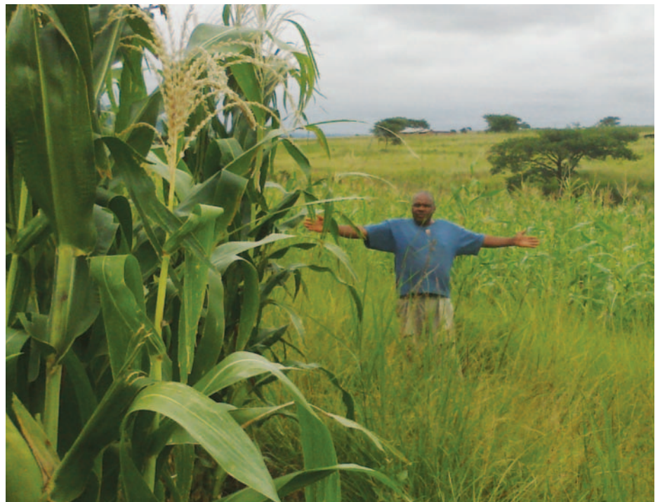
Die verskil wat dit maak as jy weet wat jy doen – Jobs Fund-mielies links en 'n ramspoe-dige gevolg regs.