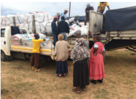
Boere ontvang kunsmis by Khumbula Nsikazi Stadion.