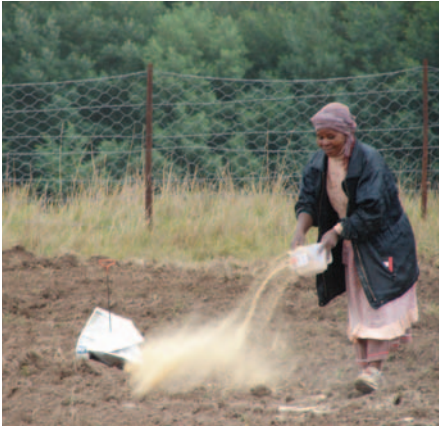
Die regte toediening van kalk lewer altyd goeie resultate.