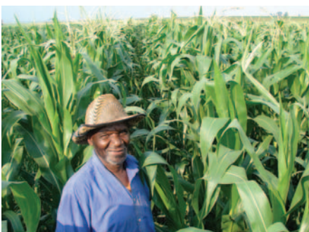
Jobs Fund-mielies in Mpumalanga.