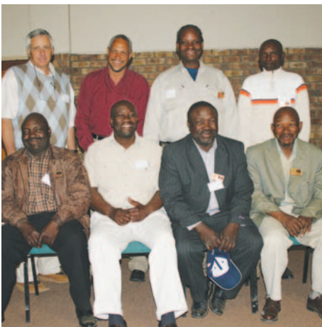
Van die ontwikkelende boere wat in 2008 lede van die 250 Ton Klub geword het.

Hoewel enige ontwikkelingsproses 'n stadige en bestendige reis is, is dit nietemin duidelik dat daar reeds heelwat is om op die gebied van ontwikkelende landbou te vier. Daar is besluit om een dag af te vat van die hantering van ontwikkelingsuitdaginge om die talle verskillende individue en instellings wat in hierdie area betrokke