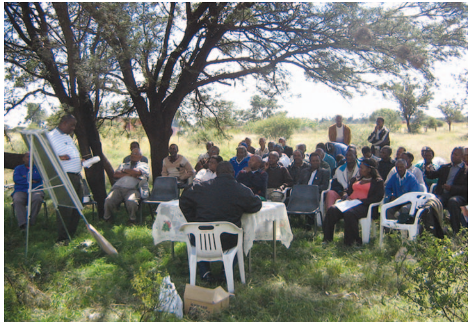
Studiegroepe vorm die basis van Graan SA se Ontwikkelende Landbouprogram.