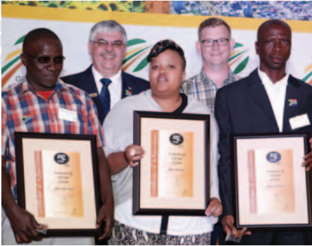
Teen 2015 het die 250 Ton Klub-lede gegroei tot 119 lede.