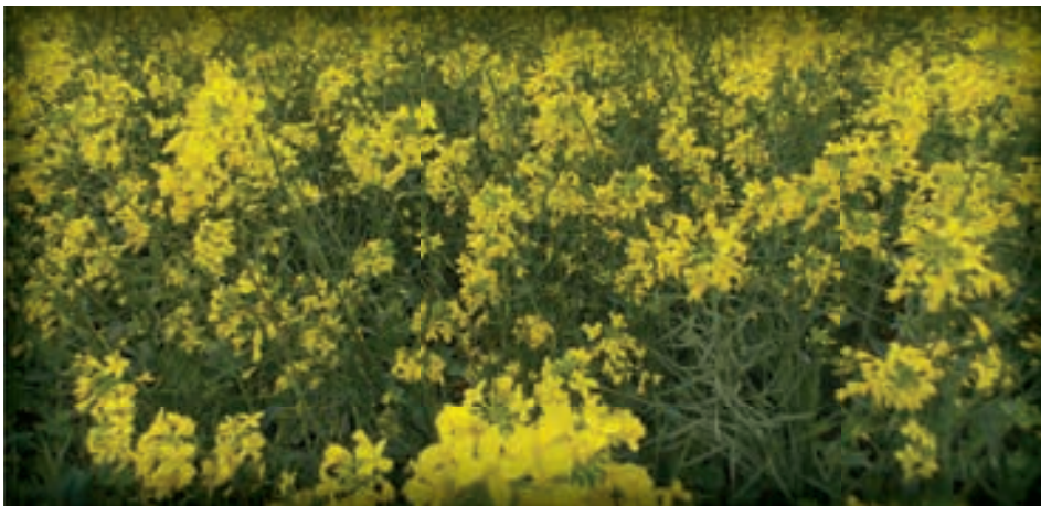
Wes-Kaap kanola lande.

K anola sou vanaf middel April tot die begin van Mei reeds geplant gewees het. Onthou dat vir elke week wat kanola aanplanting na middel April vertraag is, die gewas potensiaal verloor vir die lewering van optimale opbrengs. Gedurende Juniemaand is dit belangrik om te oorweeg om die eerste stikstof topbemsing toe te dien en daar kan dalk ook 'n behoefte aan na-opkoms onkruidodder toedienings wees.