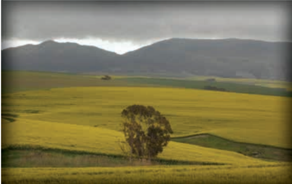
Wes-Kaap kanola lande.