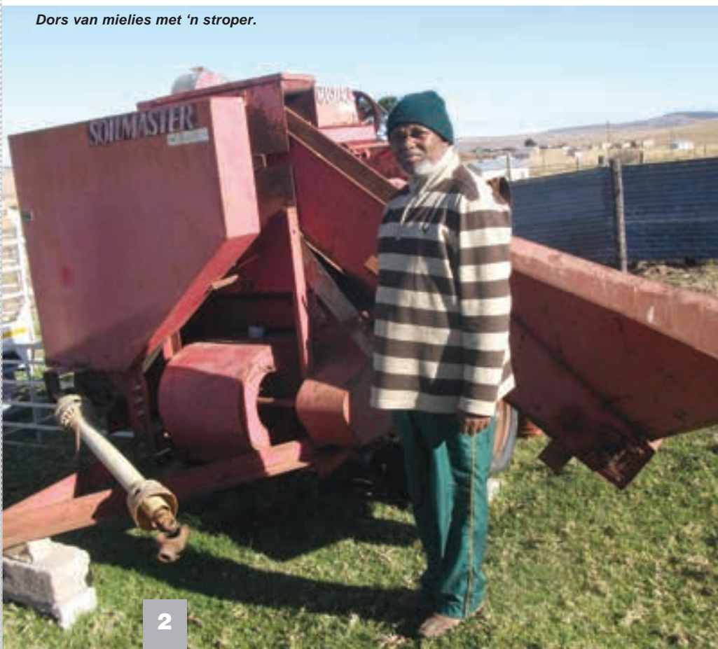
Dors van mielies met 'n stroper.

Die mielies moet nie 'n voginhoud van meer as 14% hê om vir berging of verkoop te kwalifiseer nie. Die graan kan gewoonlik met 'n voginhoud van tussen 18% en 26% geoes word en sal onmiddellik voor berging of verkoop gedroog moet word. Mieliesaad wat op hierdie vlak gestoor word, sal baie vinnig bederf. Die finale droog van die mielies kan op swart plastiekvelle of swaar poli-teen velle gedoen word nadat die mielies van die koppe afgedop is, indien produksie nog steeds op 'n klein skaal gedoen word.