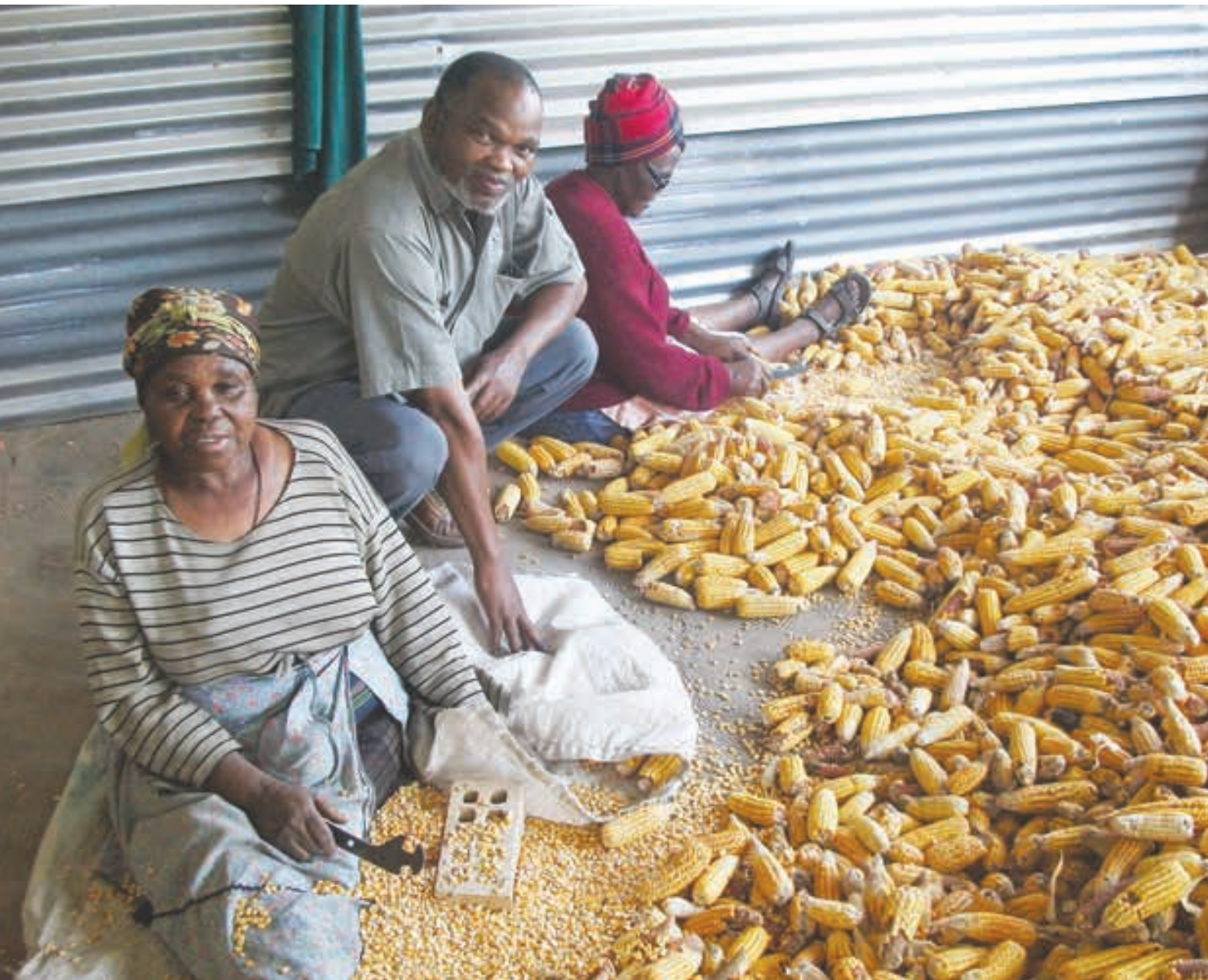
Dors van mielies met die hand.

Moenie die mielies dieper as enkeldiepte op die velle versprei nie. Dit sal genoeg blootstelling aan die son en wind voorsien. Die graan kan van tyd tot tyd omgekeer word om die onderste korrels bloot te stel aan die droogproses.