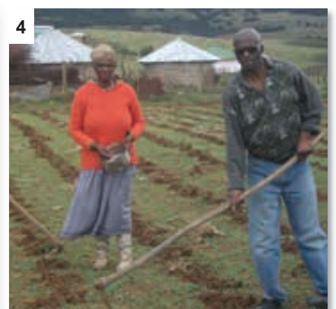
Geen-bewerkingspraktyke in Umthata.

en die oesreste van die vorige seisoene te behou. Daar is baie voordele hieraan. Die belangrikste een is dat erosie baie verminder as gevolg van die reste en wortelstrukture wat onversteur gelaat word om die grond te bind en waterafloop te verhoed.