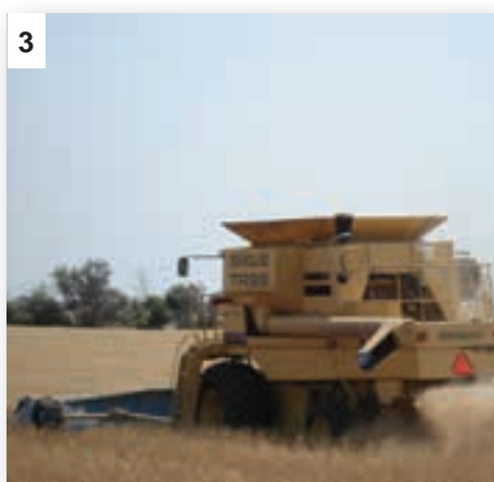
'n Goeie stroper wat die kaf eweredig uitstrooi, is baie belangrik sodat daar nie oesreshope oral op die land opdam nie.

In eenvoudige terme, is geen-bewerking wanneer 'n boer direk in die grond plant met geen bykomende bewerking nie. Dit beteken dat daar geen voorbereiding van lande voor plant is met ploëë, snyimplemente soos 'n dis, skeurtandimplemente of enige ander implemente wat die grond binnedring nie. Die fundamentele idee van geen-bewerking is om nie die bo-grond te versteur nie