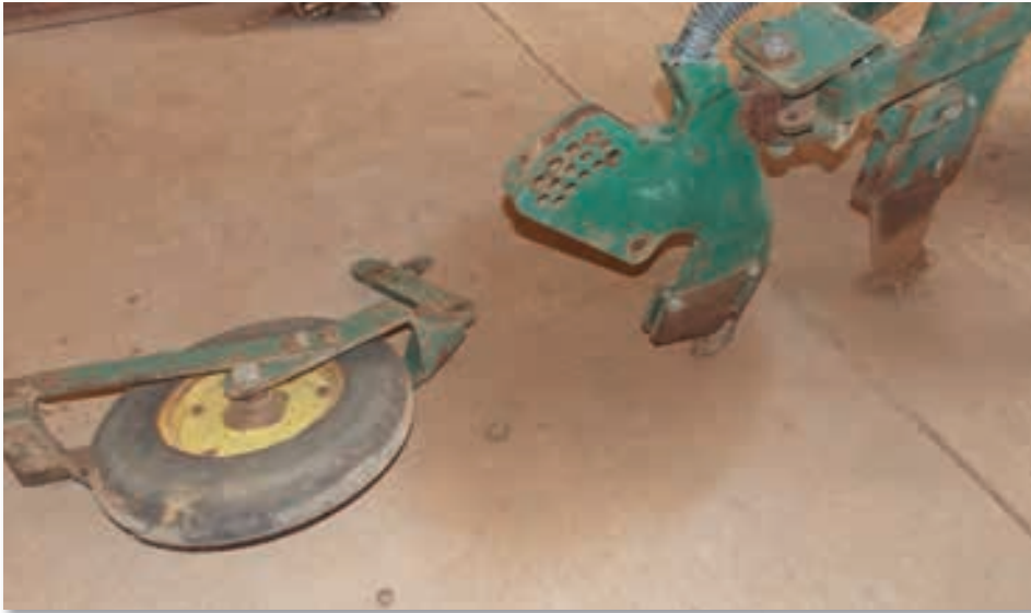
Leotwana le tlošwa gore dipering tše di onetšego di ntšhwe go be go tsenywe tše mpsha.

lekola le diširalerole tše di šireletšago dipering o lekole le ditšhišo ( seals ) go kgonthiša gore di šitiša lerole go tsena. Le ke lebaka le legolo leo le hlolago go senyega ga dipering.