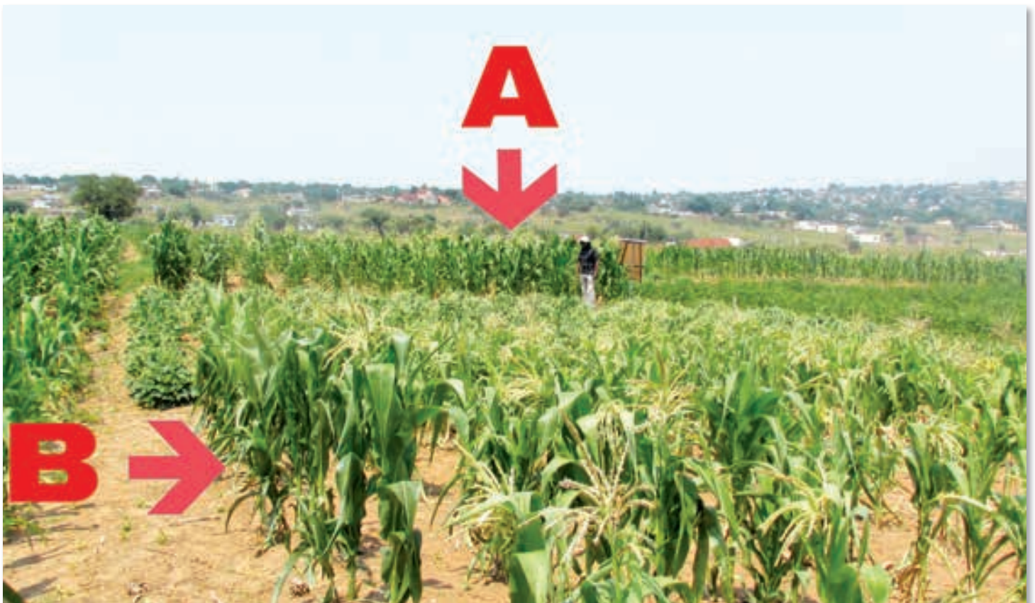
Mielies (A) in vergelyking met mielies (B) in mono-gewasverbouing, wat aangeplant is op die proefperseel. (Mede-skrywer, Mnr Nemadodzi was die navorsingstegnikus verantwoordelik vir die eksperiment.)

Wisselbou is die praktyk om verskillende gewasse vir agtereenvolgende jare op dieselfde land te plant. Dit is 'n beplande praktyk vir die langtermyn en moet nie per toeval gebeur soos dit dikwels die geval is nie. Wisselbou is 'n doelbewuste strategie waarin 'n boer kan bydra om peste en siektes onder beheer te hou. Hierdie vorm van plaag-en siektebestuur kan slegs bereik word wanneer die gewasse uit verskillende families geroteer word. Die basiese beginsel is dat grastipe gewasse soos mielies, met gewasse van die breëblaarfamilie, soos sonneblom, sojabone of akkerbone, gewissel word. Deur die