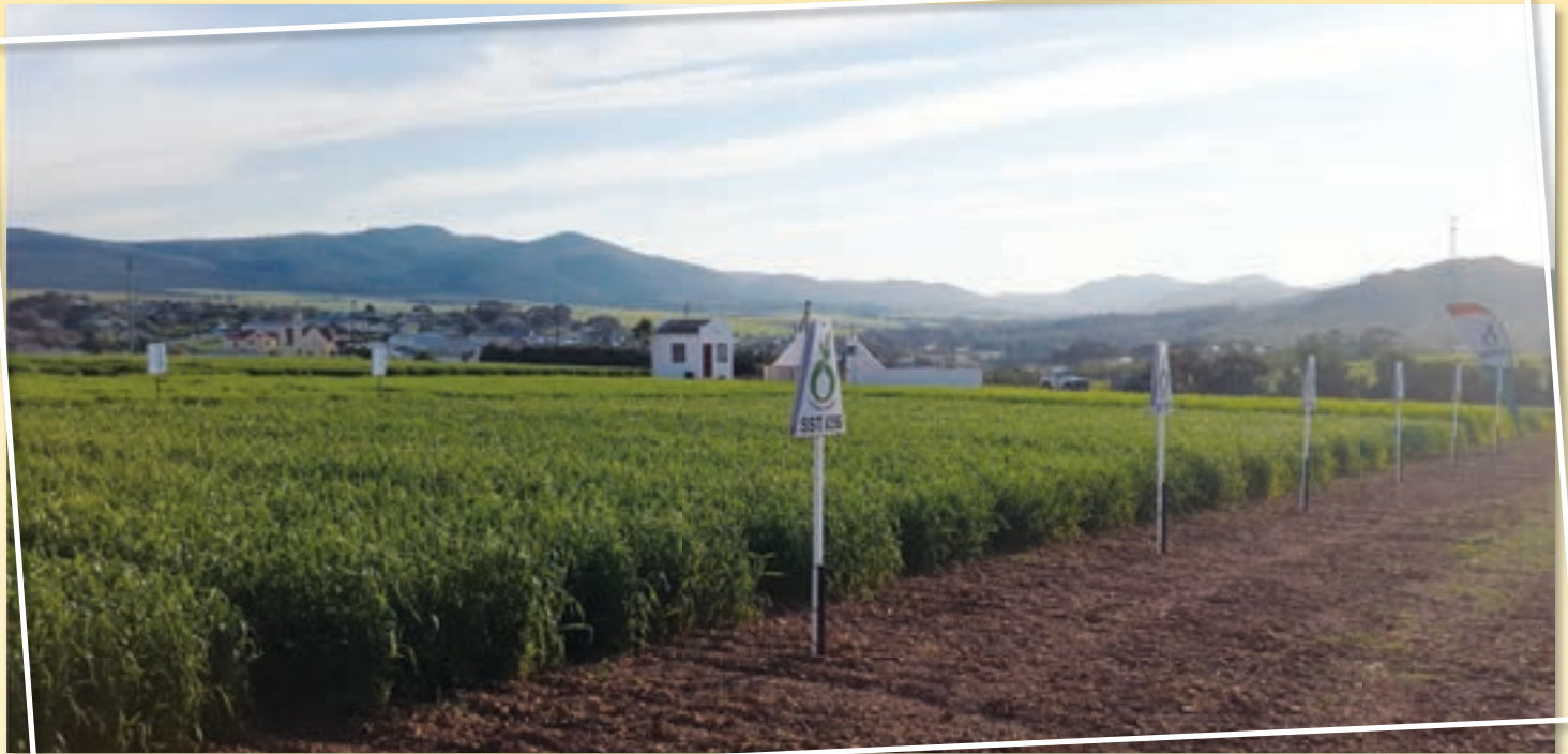
Mohlala wa tema ya maitekelo a khalthiba.

phetošopšalo ye e akaretšago korong, kanola, dilupine ( lupins ) le mehuta ya phulo lefelong na Swartland;