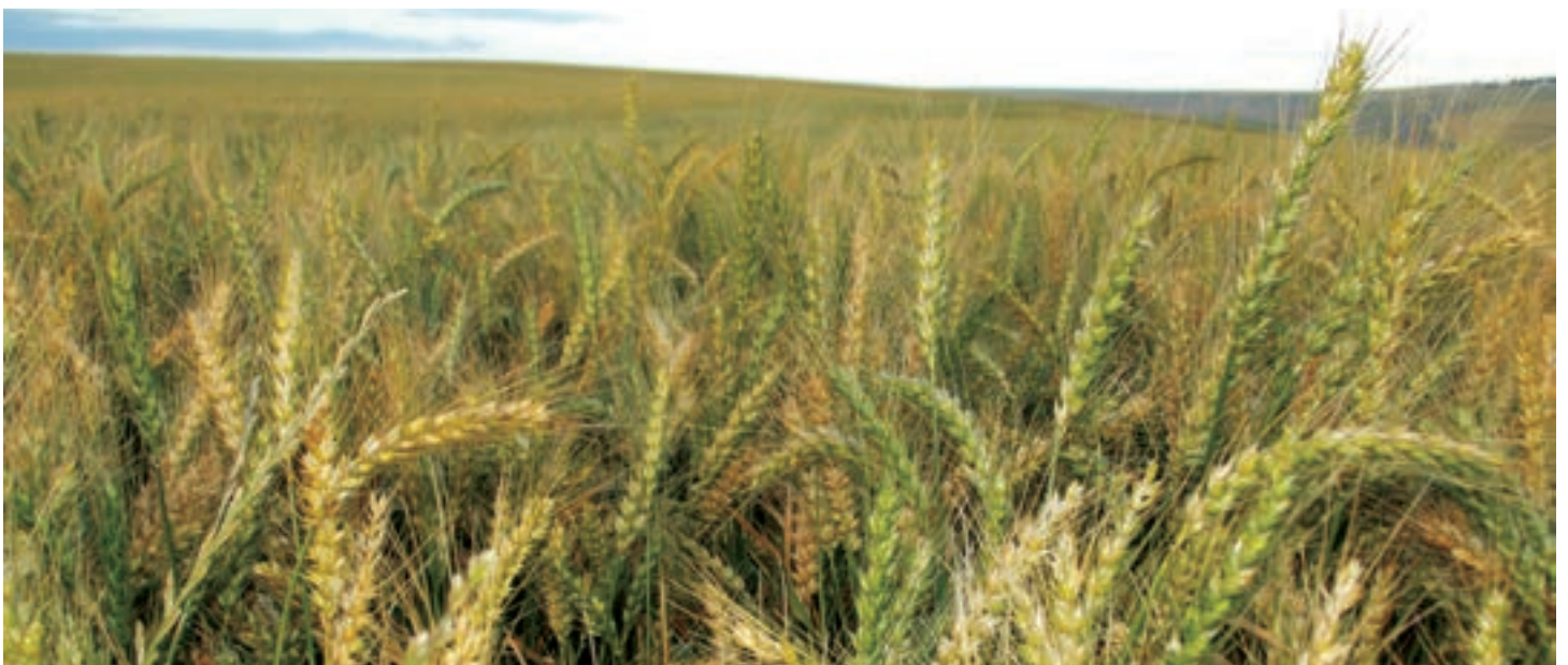
Tšhemo ya korong kgauswi le Caledon.

Taodišwana ye e ngwadilwe ke Richard Krige, Leloko la Komitiphehišo ya Grain SA le Modulasetulo wa Selete sa 27. Ge o nyaka tsebišo ya go feta ye, romela imeile go boontjieskraal@com2000.co.za.