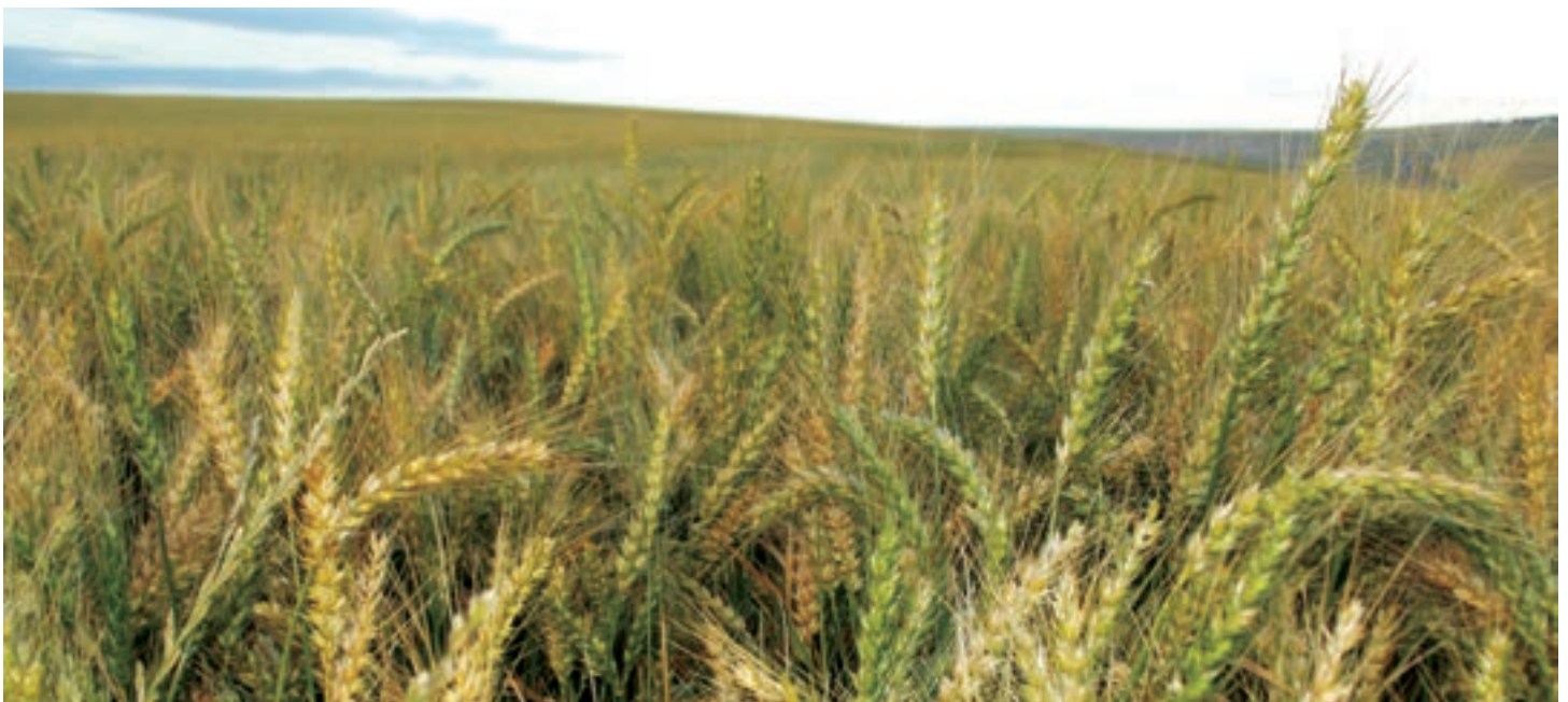
'n Koringveld net buite Caledon.